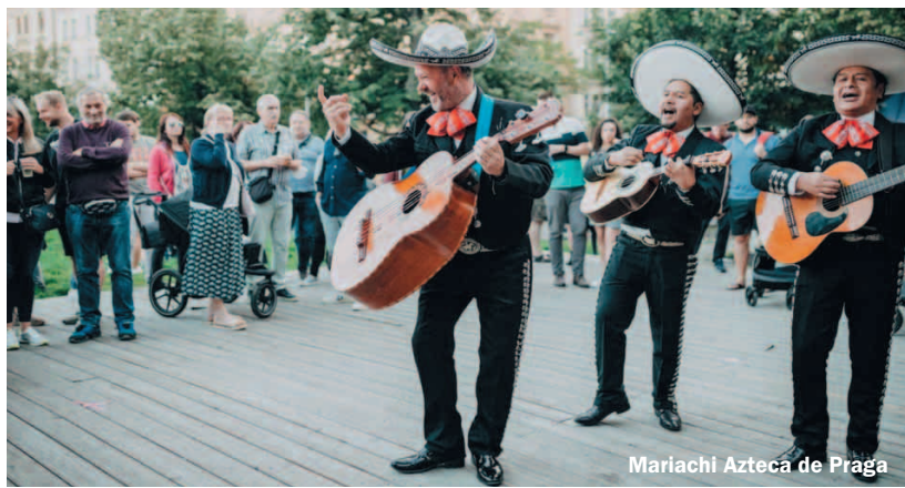
Mariachi Azteca de Praga

Aktuální info o programu najdete na webu www.kulturajablonec.cz .